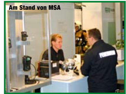
Am Stand von MSA

Im Bereich Atemschutz waren alle bekannten Firmen mit großen Ständen und umfangreicher Präsentation vertreten. Traditionell in grün-weiß zeigte sich MSA mit einer Präsentation des gesamten Portfolios – vom AirGo-Pressluftatmer bis zur innova-