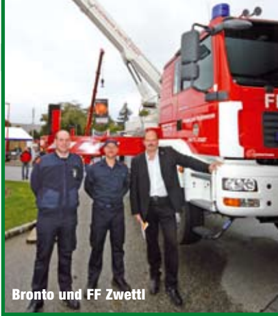
Bronto und FF Zwettl

der FF Zwettl. Der finnische Anbieter wird übrigens nächstes Jahr die 50. Bühne in Österreich ausliefern! www.bronto.ch