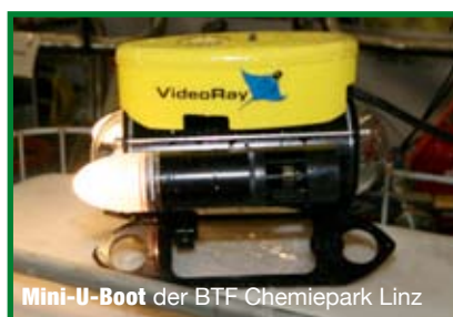
Mini-U-Boot der BTF Chemiepark Linz

der TUIS-Feuerwehren (Fachverband der chemischen Industrie) zog viele Interessierte an, welche sich ein Bild von den Möglichkeiten von TUIS machen konnten. Sensationell war das neue Abdichte-Equipment der BTF Chemiepark sowie deren Mini-U-Boot für Unterwasser-Erkundung. ( www.tuis.at )