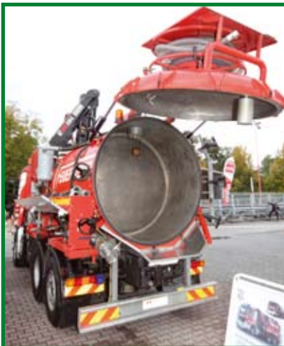
WLF auf MB Actros mit Wechselaufbau Saugtank 1200

Interessant waren die Sonderfahrzeuge der TUIS-Feuerwehren in Oberösterreich und Bayern (Gendorf, Wacker Chemie), die man am Freiglände ausgiebig begutachten konnte.